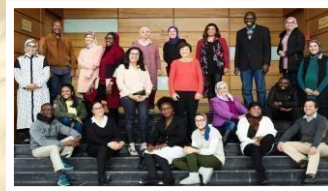
Promotion 4 DUCP