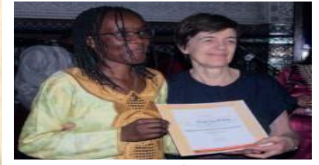
Remise des diplômes