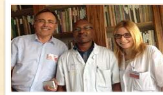
Stage en France pour les candidats